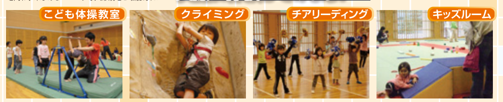
小さなお子さんでもできる体操運動を専門スタッフがリヤクアップ! 高さ15mのクライミングウォールに挑戦! ポンポンを持って、チャアリーダーになりきり体験! 240畳の柔道室は、キッズルームとして開放

注目! 「絵心グランプリ」開催! 応募のあったスポーツをテーマにした絵をエントランスへ掲示し、来館者による投票で大賞、準大賞を決定します。 ・素敵な商品が当たる!! ・ビンゴ大会開催!(1回100円)