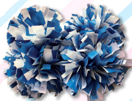
U-8~U-11クラス用ポンポン 3,000円