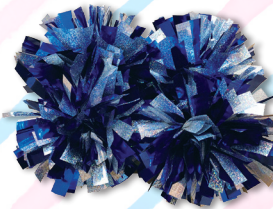
U-18クラス用ポンポン 3,000円