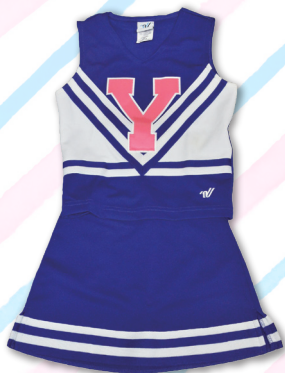
U-18クラス用ユニフォーム 16,500円