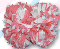
キッズクラス用ポンポン 3,000円