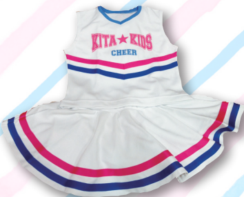
U-8~U-11クラス用ユニフォーム 14,000円

※キッズクラスはポンポンとチアリボンをご購入いただけます。 ※表記価格は全て税込価格です。 ※年度内に金額が上がる可能性があります。