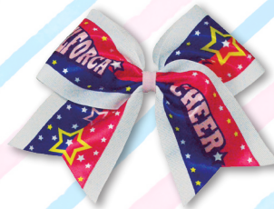
U-18クラス用 チアリボン 2,000円