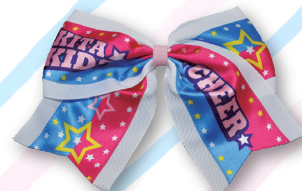
キッズ~U-11クラス用 チアリボン 2,000円