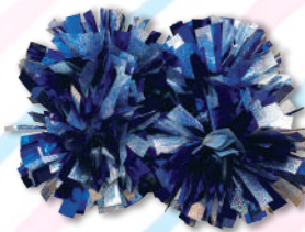
U-18クラス用ポンポン 3,000円