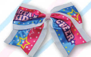
キッズ~U-11クラス用 チアリボン 2,000円