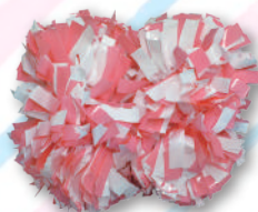
キッズクラス用ポンポン 3,000円