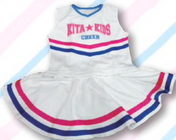
U-8~U-11クラス用ユニフォーム 14,000円

※キッズクラスはポンポンとチアリボンをご購入いただけます。 ※表記価格は全て税込価格です。 ※金額が多少異なる場合がございます。