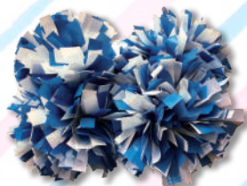
U-8~U-11クラス用ポンポン 3,000円