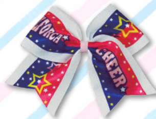
U-18クラス用 チアリボン 2,000円