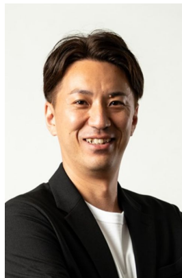
北海道イエロースターズ【バレーボール】