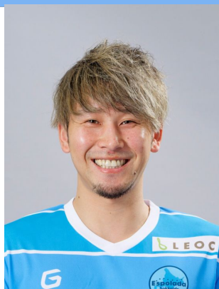
エスパラダ北海道【フットサル】